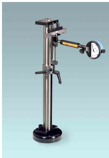
ESU - in senkrechter Einstellachse