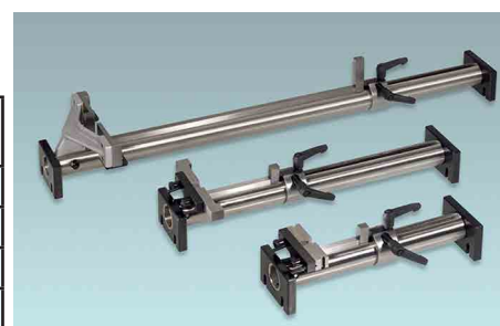
ESU - in waagrechtener Einstellachse